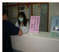
修訂領藥作業標準書